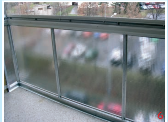
Výplň zábradlí je nedílnou součástí zasklení

K zasklívacímu systému je také nabízena celá řada doplňků na přání (doplňkové těsnící lišty mezi skla, stropní sušák na prádlo, stínící prvky – horizontální a vertikální žaluzie apod.). Samostatně je pak řešena otázka zakrytí otvorů v zábradlí. Zábradlí jsou na našich objektech svým provedením velmi různorodá a proto je způsob výplně daného zábradlí řešen samostatně od zasklení horní části lodžie. Jako příklad zde uvádíme použití systému s klasickým betonovým zábradlím, betonovým zábradlím a ocelovou tyčí, ocelovým zábradlím bez výplně, ocelovým zábradlím a částečnou výplní, ocelovým zábradlím a celoplošnou výplní. Rovněž může být systém instalován s kompletní výměnou starého zábradlí za nové (viz obr. 2, 6).