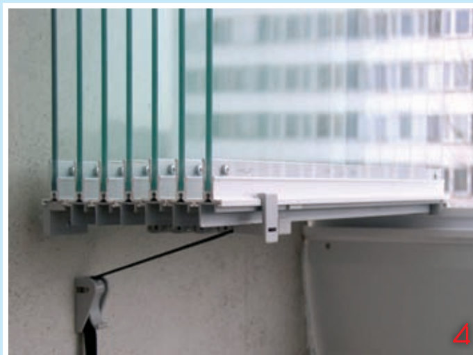
Aretace otevřených oken