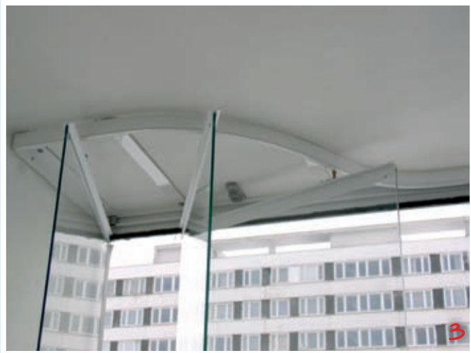
Otáčení skleněných dílů

Skleněná výplň je tvořena tvrzeným sklem o tloušťce 6 mm. Výroba tvrzeného skla spočívá v zakalení již jinak připravených skleněných dílců. Tímto procesem získává dané sklo na pevnosti v ohybu, je také zvýšena jeho odolnost proti rozbití a při případné destrukci nedochází k tvorbě nebezpečných střepů. Skleněná výplň je na horním a spodním okraji zasazena do hliníkových lišt, na kterých jsou upevněny další komponenty pro funkci systému. Spodní kluzné vedení je tvořeno opět hliníkovým výliskem. Zasklením lodžie systémem IVETA se zvyšuje několikanásobně ochrana majetku a to hlavně v nižších podlažích (viz obr. 7).