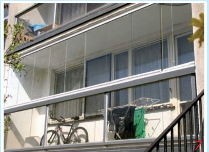
IVETA Vás chrání před zloději